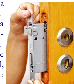
A FECHADURA ENGUIÇOU OU PRECISA SER TROCADADA? VOCÊ MESMO PODERÁ RESOLVER.

Leitura de projetos, conhecimento para a Vistoria Técnica Obrigatória, capacitação para a contratação e supervisão dos serviços, execução de manutenção civil, com conhecimento de tecnologia dos materiais das práticas do curso.