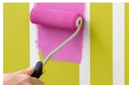
PINTE SUA CASA OU APARTAMENTO, VOCÊ MESMO!

No Módulo I desenvolveremos ou aperfeiçoaremos habilidades no manuseio ferramental, destacando nas práticas a segurança, uso correto do ferramental e leitura de projetos.